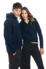
B&C Hooded & B&C Cat /women